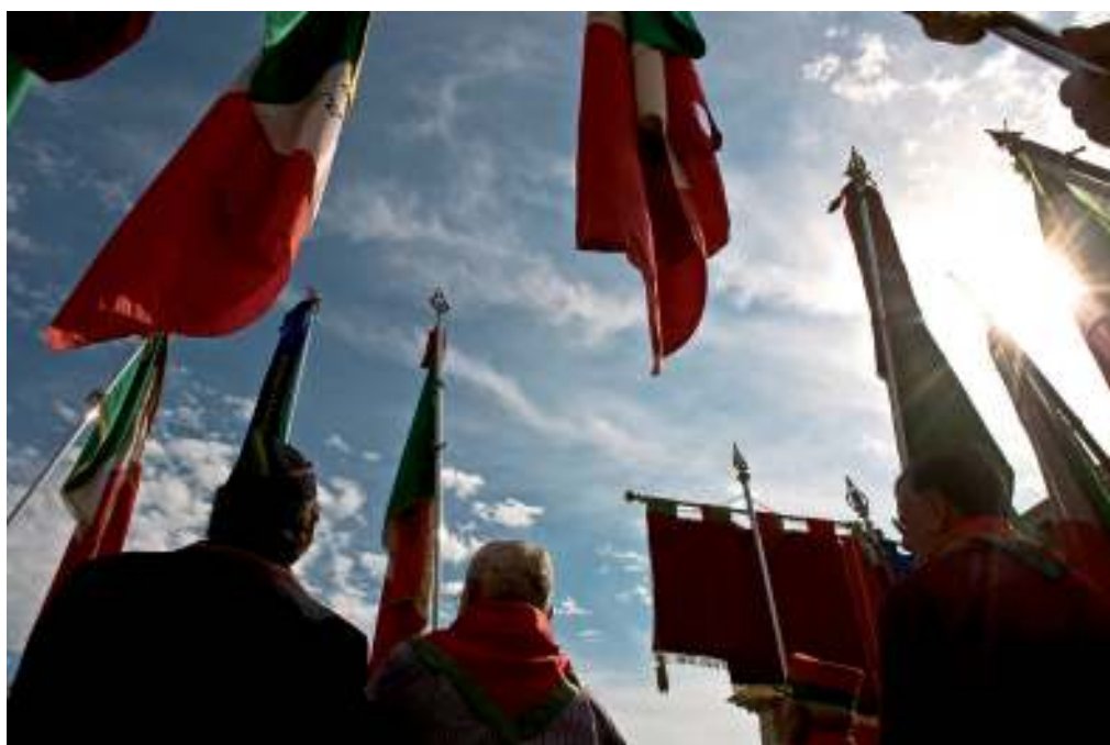
celebrazioni "festa di garibaldi"