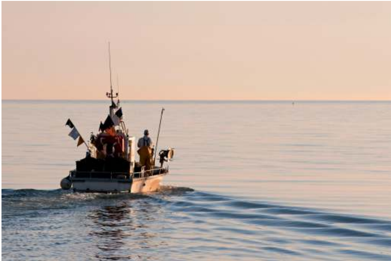
barca da pesca