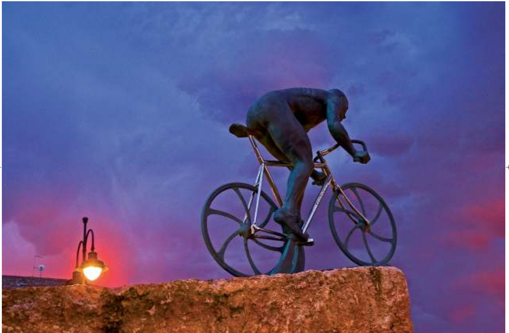
monumento a marco pantani