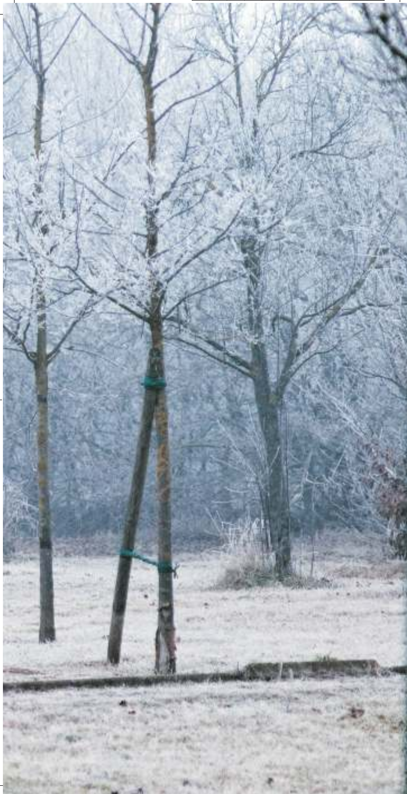
il parco di levante