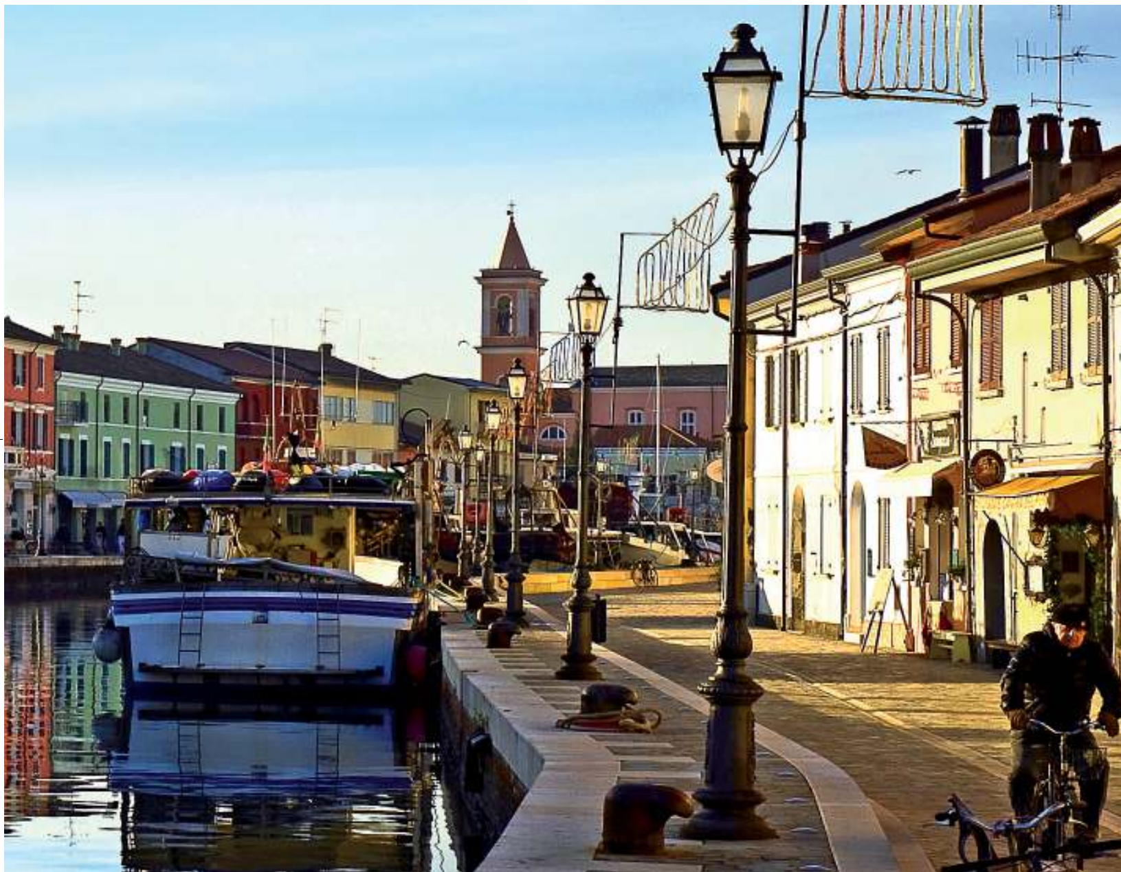
il porto canale